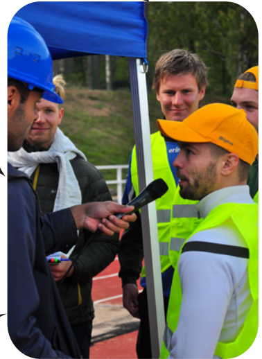
VASTAA KIPERIIN KYSYMYKSIIN