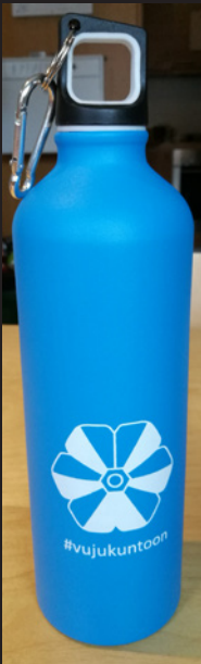
Juomapullo - 5€