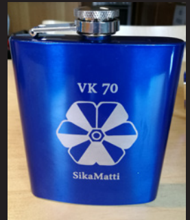
Sikamatti - 5€