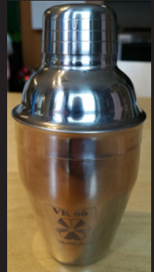
Sikashaker - 7€