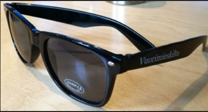
Aurinkolasit - 5€