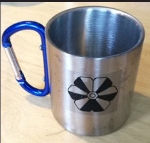
Rosterimuki - 2€