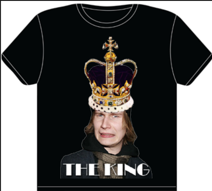
Paita nro. 5 The King. Ennen vallanvaihtoa on hyvä muistaa että killassa on yksi ja ainoa kuningas.