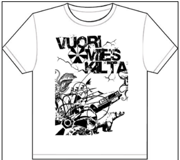
Paita nro. 2 Virallinen kilta-t-paita. Suunnittelukilpailun voittaja. Suunnittelija: JLy