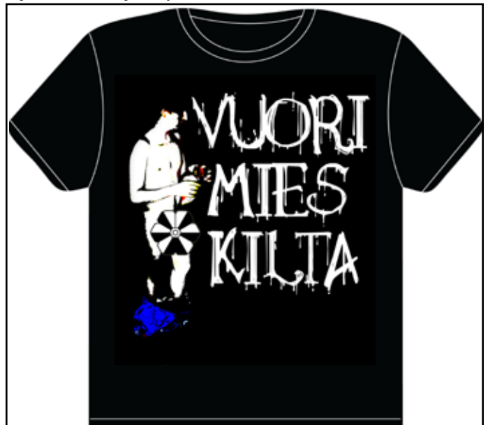
Paita nro 4. Kilta-t-paidan ensimmäinen versio. Epäedustavuuden takia rajoitettu 10kpl:n koe-erä!!