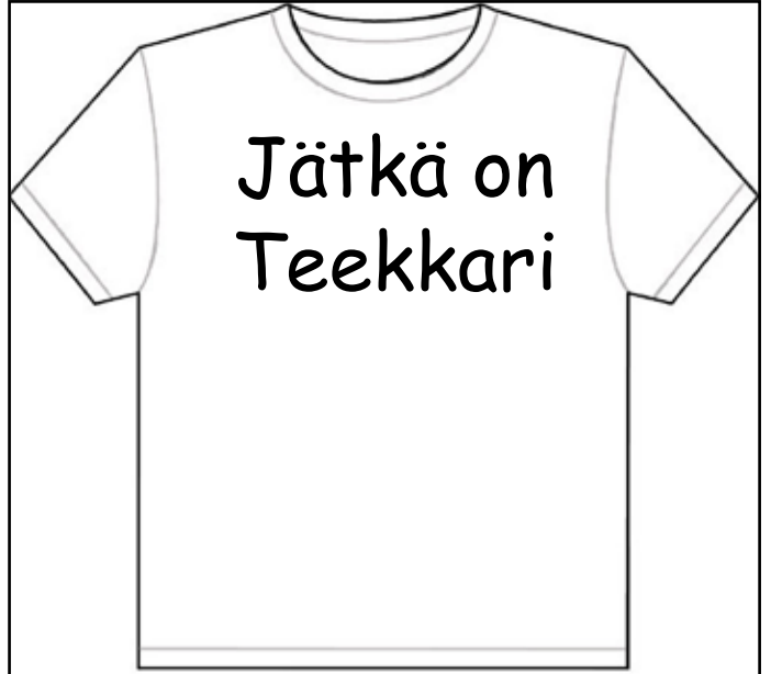
Paita nro. 6 Jätkä. Varama valinta kaikkiin tilaisuuksiin.