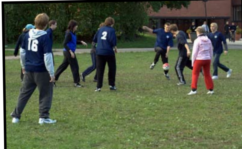
Tiukka pelitilanne fuksien maalilla

Ilta loppui aikanaan ja fukseille saatiin hyvä mieli karvaasta tappiosta huolimatta. ”Ensi vuonna tekin pelaatte voittajajoukkueessa”.