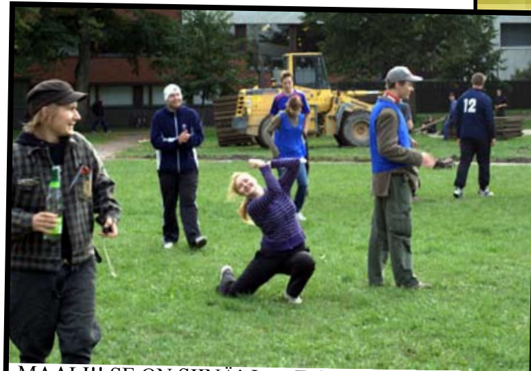
MAALI!! SE ON SIINÄ! Jopa Fobe hymyilee