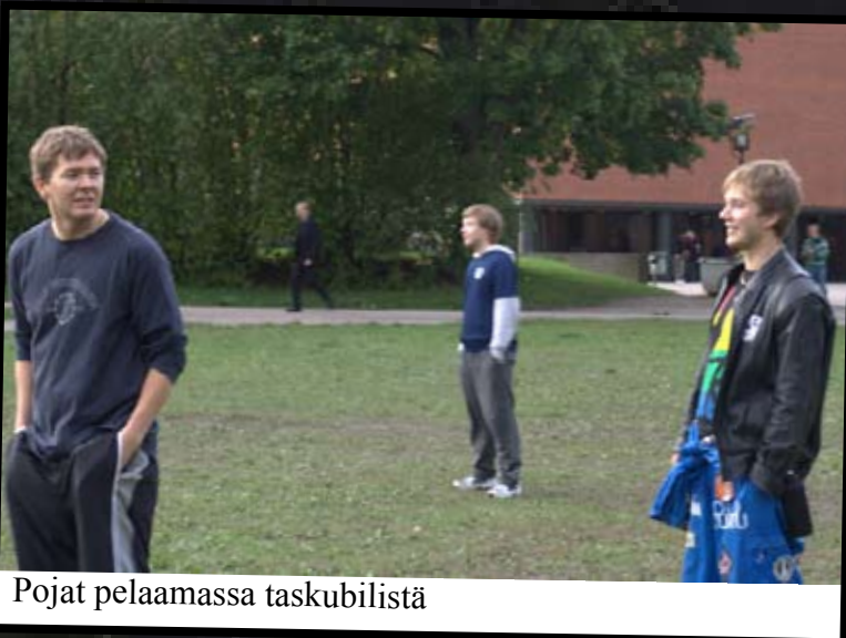
Pojat pelaamassa taskubilistä