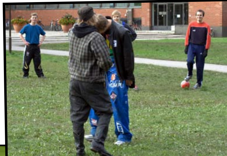
Sikailusta rankaistaan punaisella kortilla